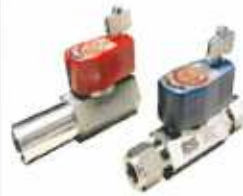
Key Lock Ball Valve