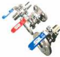
3PCS Ball Valve