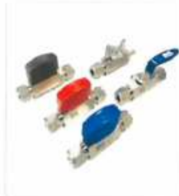
Hex Ball Valve