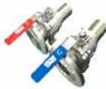
2PCS Ball Valve