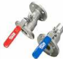
1PC Ball Valve